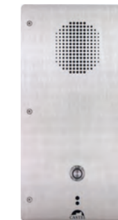
XE-1B-CELL-SENS Poste cellule audio Full IP/SIP avec 1 bouton d'appel et face avant sensitive REF 550.5510