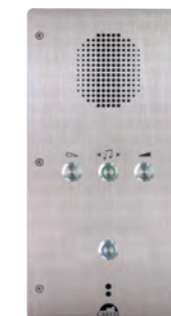
XE-1B-CELL-RADIO Poste cellule audio Full IP/SIP avec 1 bouton d'appel et fonction radio REF 550.6000