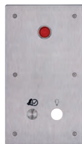
PL-1B-COR-H-L Platine couloir avec 1 bouton d'acquiescement, 1 hublot et 1 réservation pour commande veilleuse REF 550.0965