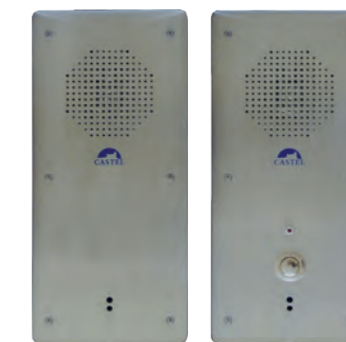
POSTES PARLOIR Postes pour secteur pénitentier parloir REF 480.8000 REF 480.8100