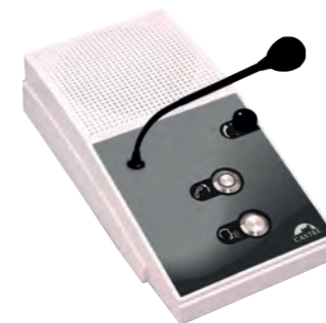
KIT INTERPHONE DE GUICHET PLATINE AV Kit composé d'un poste opérateur et d'un poste client (visiteur) version platine anti-vandale REF 470.9300