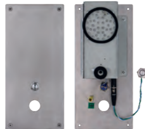
XE-1B-HUISSERIE Kit cellule Full IP/SIP pour intégration dans huisserie REF 550.0600