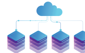
Serveur Max Virtuel