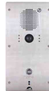
XE-V1B-CELL-ADAPT Poste cellule audio vidéo Full IP/SIP conforme PHMR REF 550.5410