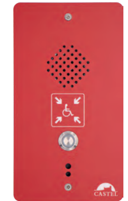
Poste REFUGE EAS