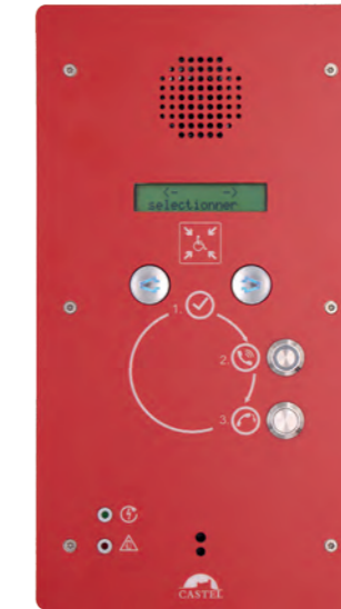
Centrale REFUGE EAS