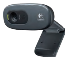
WEB CAM Caméra Web quick pro REF 330.5400