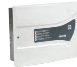
ALIM AES 24V 3A S Alimentation AES 24V 3A 7Ah sécurisée (batteries) conforme norme NFS 61940 REF 350.1400