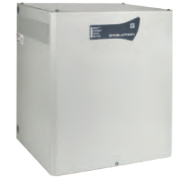
COFF ALIM 24V16A Alimentation coffret 24V 16A sécurisée (batteries) REF 350.1200