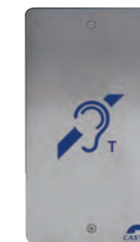
BOUCLE INDUCTION Boucle à induction magnétique déportée (intégration en boîtier ABS et face avant inox). Prévoir alimentation 24V REF 540.3100