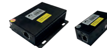
IP 2 WIRES CONVERTER Permet le raccordement d'un équipement IP distant sur 2 fils. Composé d'1 module "récepteur" installé en amont et connecté au switch et d'1 module "transmetteur" installé en aval et connecté à l'équipement IP distant. REF 310.5000-1