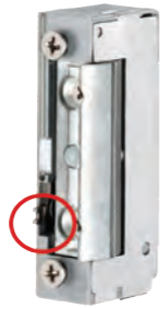
GÂCHE 128 E SS TET 10/24V Gâche électrique à émission de courant et contact stationnaire REF 320.1800