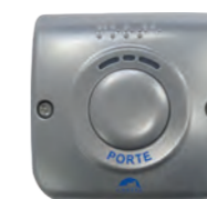
BP SORTIE H ZAMAK Bouton de sortie conforme loi handicap en Zamak (IP54 - IK09) REF 330.1200