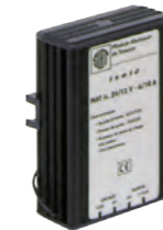
CONV 24/12V Convertisseur 24/12VDC 3A REF 350.1600