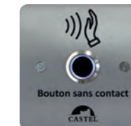
BP SORTIE SANS CONTACT Bouton de sortie sans contact conforme loi handicap en inox avec 2 relais REF 330.1150