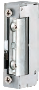
GÂCHE 128 SS TET 10/24V Gâche électrique à émission de courant et contact stationnaire REF 320.1700