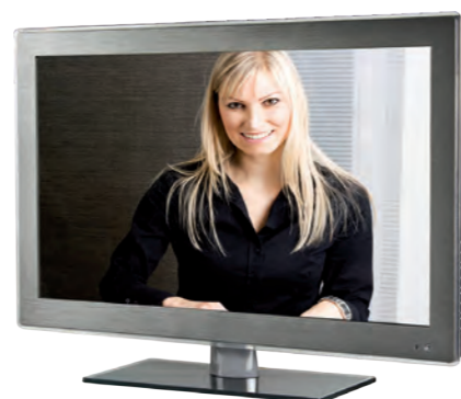
MONITEUR COUL 21" Moniteur couleur 21" VGA et BNC REF 310.0100