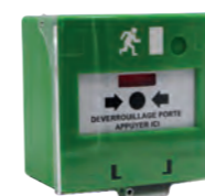
BBGV DOUBLE CONTACT Déclencheur manuel vert 2 contacts REF 320.3000