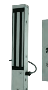
VENTOUSE APPLIQUE 300KG 24V Ventouse en applique conforme NFS61937 REF 320.1300