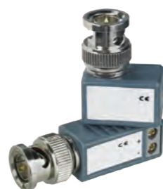
KIT ÉMETTEUR/RÉCEPTEUR Kit émetteur récepteur vidéo Balun 1 paire cat5 REF 310.3000