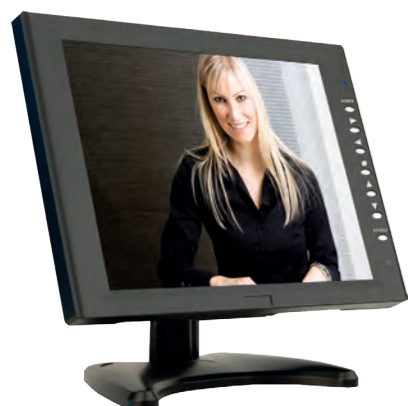
MONITEUR COUL 10" Moniteur couleur 10" VGA et BNC REF 310.0000