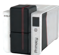
IMPRIMANTE DF Imprimante PRIMACY 2 EVOLIS (double face) avec logiciel cardpreso REF 330.5700