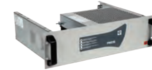
RACK ALIM AES24V24A Alimentation rack AES 24V 24A sécurisée (batteries) REF 350.1300