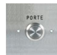
BP SORTIE Bouton de sortie REF 330.1000