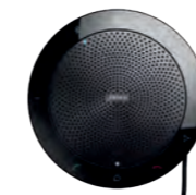
HP/MICRO USB BLE Jabra Speak 510 enceinte micro USB et Bluetooth portable (Batterie rechargeable) REF 300.0000