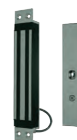
VENTOUSE ENCASTRE 300KG 24V Ventouse en encastré conforme NFS61937 REF 320.1200