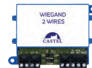
WIEGAND 2 WIRES Permet le raccordement d'un lecteur de contrôle d'accès Wiegand (26/30/34/37/56 et 58 bits) sur une centrale IPEVIA Secur 4L 2F. Max 100 mA. Gestion de la Led verte uniquement. REF 910.0143