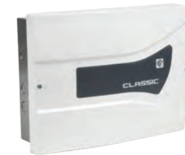
ALIM A24V 6A S Alimentation coffret 24V 6A sécurisée (batteries) REF 350.1500