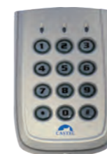
CLAVIER AUTONOME Clavier à code autonome en Polycarbonate (IP65) avec 2 relais - 1 buzzer REF 330.0000