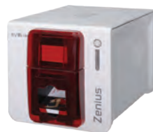
IMPRIMANTE SF Imprimante ZENIUS EVOLIS (simple face) avec logiciel cardpreso REF 330.5000